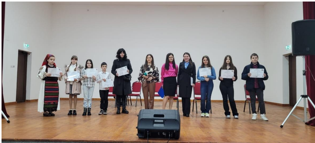
Festivalul- Concurs interjudețean de colinde „Mândră-i sara de Crăciun” Agrieș