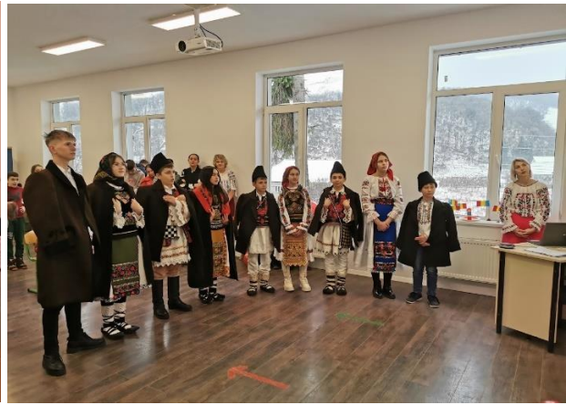
Tabără organizată de Asociația POV21 pentru elevii care provin din medii defavorizate